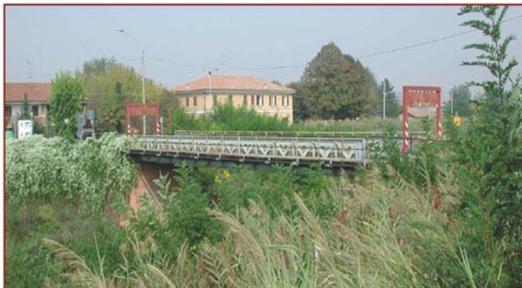
Il Ponte d'Accursio oggi

E' prevista quindi una chiusura del ponte in data ancora da stabilire e in tempo utile sarà diffusa attraverso l'URP, attività di volantinaggio, il nuovo portale del Comune e gli altri mezzi di comunicazione, l'informativa relativa alla viabilità alternativa. ■