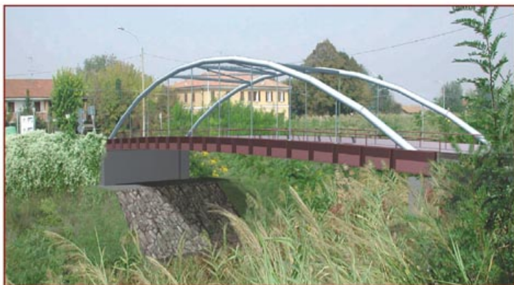
Il Ponte d'Accursio dopo i lavori (simulazione)