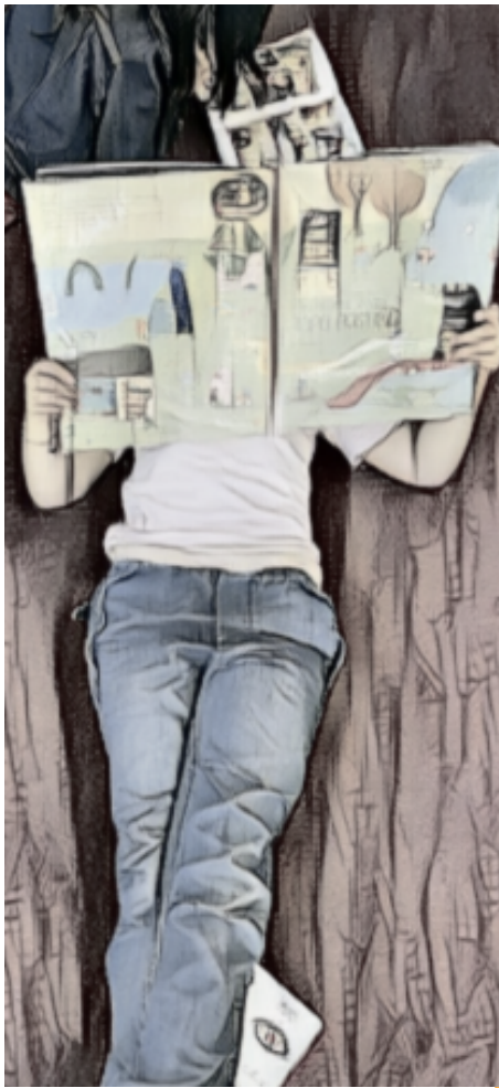
immagine tratta da giornata di lettura in biblioteca a Budrio