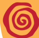
Ca' Rossa Teatro