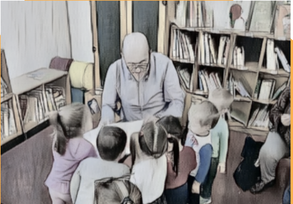
immagine tratta da giornata di lettura in biblioteca a Budrio

È possibile partecipare con due sezioni contemporaneamente.