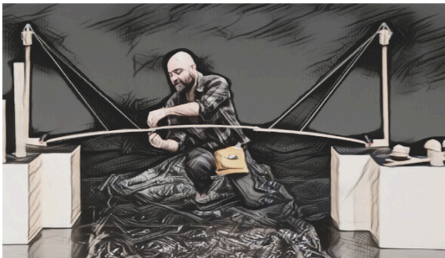
Immagine tratta dallo spettacolo "Costruttore di storie"