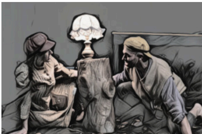
Immagine tratta dallo spettacolo "Hansel e Gretel - Fratelli unici"