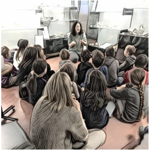
immagine tratta da giornata di visita e laboratorio nel Museo Archeologico e Paleoambientale

Visita guidata animata attraverso le sale del Museo per muovere i primi passi a conoscere le differenze tra il presente e il passato; a seguire laboratorio di manipolazione e lavorazione dell'argilla.