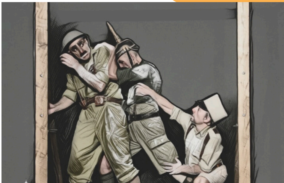
Immagine tratta dallo spettacolo "Operativi - Siamo uomini o caporali"

Tra gags classiche, divertenti e sorprendenti, fraintendimenti e tradimenti, si guarda con i nostri occhi di sempre l'ingenuità dei clown e la debolezza dell'uomo, per ridere di entrambi in uno spettacolo e per ripensarci tornando a casa, magari davanti alla tv e al solito TG.