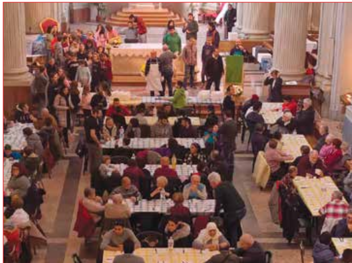
Grande successo in San Lorenzo per il pranzo solidale organizzato dalla Caritas e da altre associazioni a cui hanno partecipato fedeli di vari credi