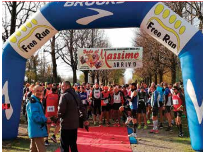
Una bella giornata ed un'ampia partecipazione, come sempre, alla sesta edizione del Memorial Massimo Miccoli a Mezzolara