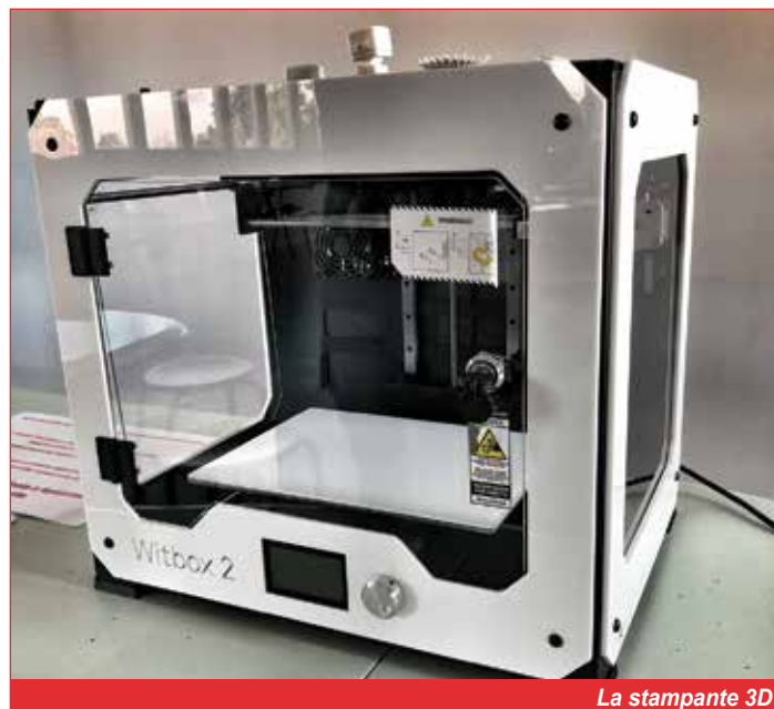
La stampante 3D