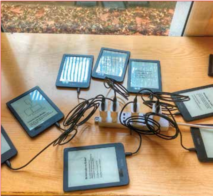
Alcuni e-reader in carica

L'Associazione Amici della scuola ha contribuito all'acquisto di arredi - tavoli, sedie, scaffali, per rendere l'aula più funzionale.