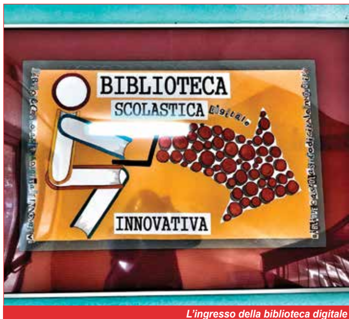
L'ingresso della biblioteca digitale