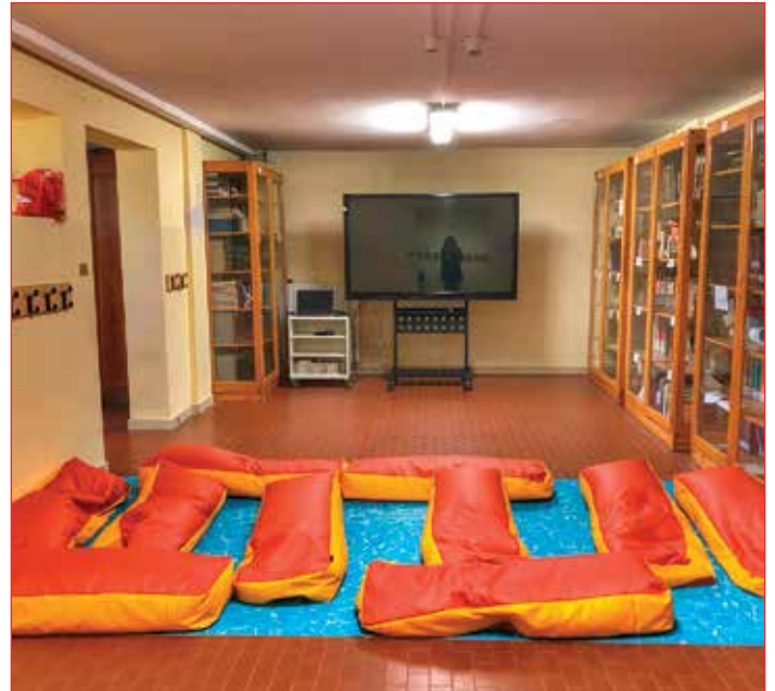
Sala proiezione della biblioteca digitale

Tutto l'impianto elettrico e di cablaggio è stato offerto