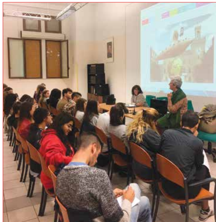
Lezione di storia dell'Ocarina all'Istituto Salesiano

(25-28 aprile 2019) e seguirà una mostra di tutti gli elaborati proposti dai ragazzi. ■