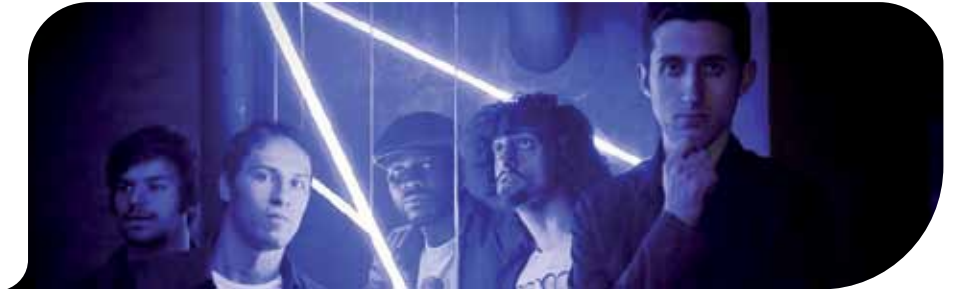
Palco Numero Cinque

Se appoggi un dito in un punto qualsiasi di una cartina dell'Emilia-Romagna probabilmente proprio in quel punto, è nato