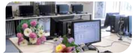
La nuova aula di informatica

Mezzolara. Col ricavato della prima edizione, andata esaurita in brevissimo tempo, si è allestita una nuova e moderna aula informatica per i bambini della scuola di Mezzolara, inaugurata alla presenza delle autorità locali e di un folto pubblico di genitori e bambini, il 10 maggio scorso. Il libro è disponibile a Mezzolara presso Oreficeria Soverini, Bottega della nonna, Lavasecco, Forno Gadignani, Immagine parucchieri e a Budrio presso Cartoleria Nanni,