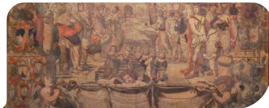
"Il bambino prodigio"

In occasione di SBAM! - cultura a porte aperte - promosso dalla Provincia di Bologna e dai Distretti Culturali, Budrio propone nella giornata di Domenica 16 novembre due eventi. Il primo, "Una Culla di suoni" , al mattino in Biblioteca, dalle 10.30 alle 12 cura di OpenGroup, un incontro di promozione alla lettura rivolto alle neo mamme e ai bambini da 0 a 3 anni e le loro famiglie, promosso nell'ambito del progetto nazionale Nati per la musica. Tiriterie, filastrocche, conte, e ninna nanne popolari, anche provenienti da diversi paesi del mondo, da leggere, cantare e recitare tutti insieme per cullare i più piccoli, seguendo il ritmo della musica, giocando con il corpo, modulando la voce e la sua intonazione. I genitori potranno condividere le ninne nanne e le canzoncine da mimare che conoscono, in particolare quelle della tradizione orale, che magari hanno caratterizzato la loro infanzia, scoprendo, inoltre, anche altri stili educativi e di cura del bambino. Nel pomeriggio, per la rassegna dedicata a meglio conoscere il patrimonio storico e artistico