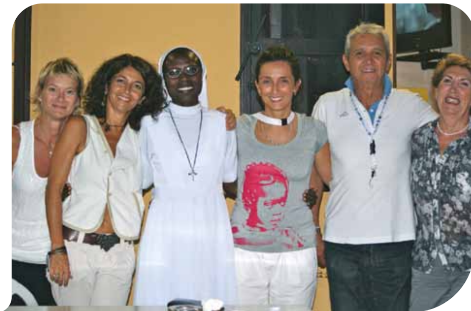
La suora responsabile dell'orfanotrofio senegalese ed i soci fondatori degli Amici i Giò

crisi, di raccogliere fondi da destinare al bene della comunità. Un grazie anche ai donatori che hanno reso possibile la realizzazione del progetto e per concludere un messaggio a tutte le altre associazioni per invitarle a valutare il progetto degli