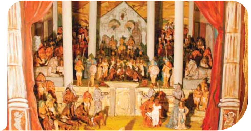
La scultura di Roberto Barbato