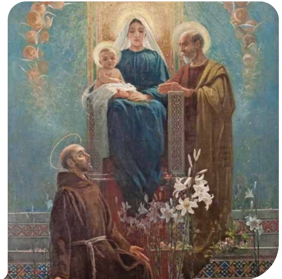
La Pala dei Capuccini