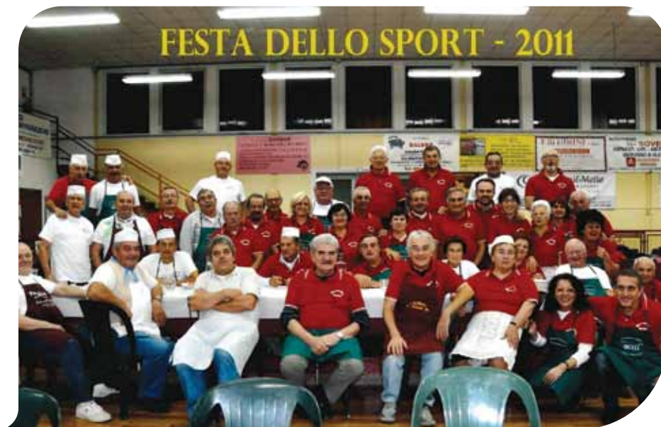
Il gruppo dei soci e dei volontari della Bocciofila

sofia, possiamo dire che "Chi ci conosce sa chi siamo, chi non ci conosce venga a trovarci!". Siamo nati per costruire sul territorio un luogo di idee ed aggregazione e vorremmo lasciare nel tempo, un ambiente sano caratterizzato dalla solidarietà e dal senso civico dei suoi iscritti. A tutti voi lettori del Notiziario Comunale, gli auguri