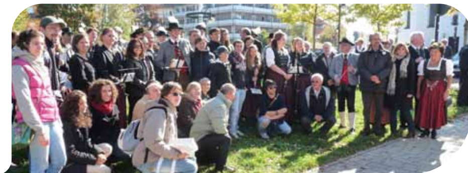
Ultima foto insieme prima della partenza

La Banda Giovanile di Budrio, assieme ad una delegazione ufficiale del Comune di Budrio, è stata invitata ad Eichenau, cittadina a pochi chilometri da Monaco di Baviera, per partecipare a questi festeggiamenti. La B.Band non si è lasciata sfuggire l'occasione per fare ascoltare la propria musica, ricevendo ampi consensi dal pubblico sia nell'incontro ufficiale del sabato mattina, con tanto di interventi dei Sindaci, sia nella più informale e "godereccia" serata con intrattenimento di vario genere in cui siamo riusciti a scaldare ed a farci apprezzare dal numeroso pubbli-