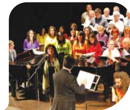
Il Coro Universitario di Santiago del Cile

Il coro Bellini con molta generosità ha pensato di aprire questa iniziativa al gruppo di cileni presente in Europa per una tournée in alcuni paesi vicini, e alla fine il risultato lo abbiamo visto e vissuto nel teatro consorziale il 29 di ottobre di quest'anno, con un pubblico sorprendente: attento