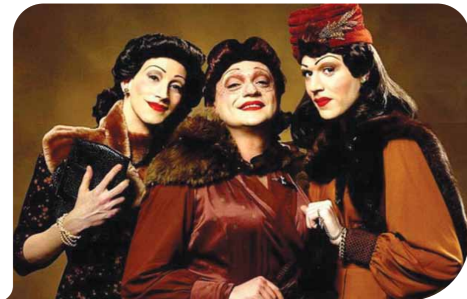
Le Sorelle Marinetti

Continua la rassegna organizzata dall'Associazione Black Mamba che prevede alcune proiezioni presso la sala BigHole di Via Zenzalino Nord n.7. Il prossimo appuntamento è per il 23 dicembre, data in cui sarà proiettato alle ore 21.30 il film Capitalism: A Love Story . Film del 2009 di Micheal Moore. La partecipazione all'iniziativa è riservata agli associati ed è completamente gratuita. Per informazioni 0516928286. ■