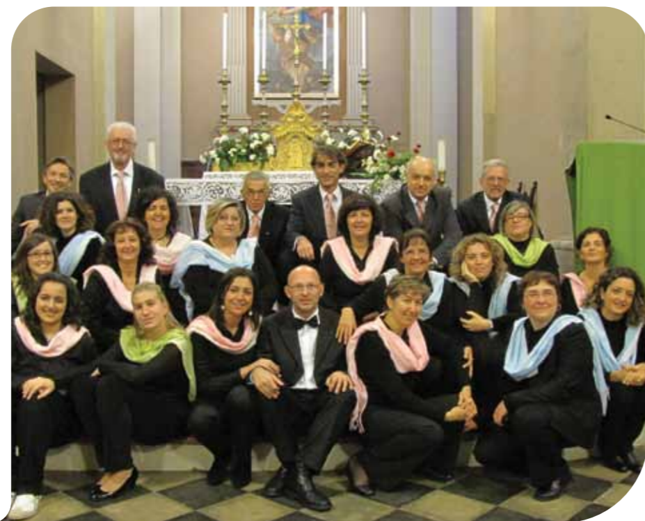
La Corale di San Michele Arcangelo

Eventi, mostre, spettacoli, presepi nel territorio budriese