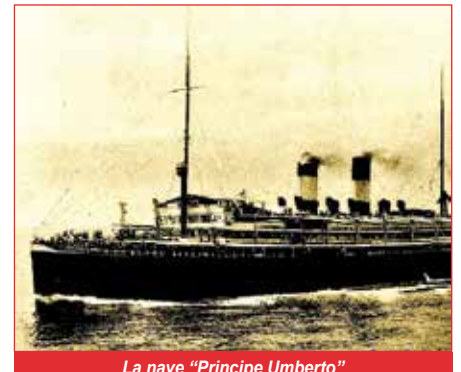
La nave "Principe Umberto"