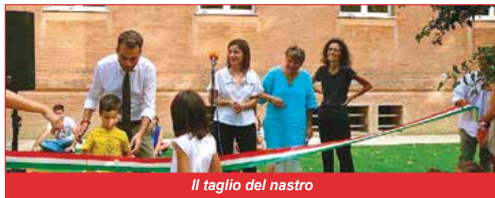
Il taglio del nastro

tutti coloro che hanno contribuito a questo progetto ed in modo particolare alle aziende sponsor, alle Dirigenti, a Proloco Budrio e ai volontari che hanno lavorato allo stand Avis per il punto ristoro. Grazie anche all'Associazione Diapason Progetti Musicali che ha rallegrato con la musica questa giornata di festa. ■