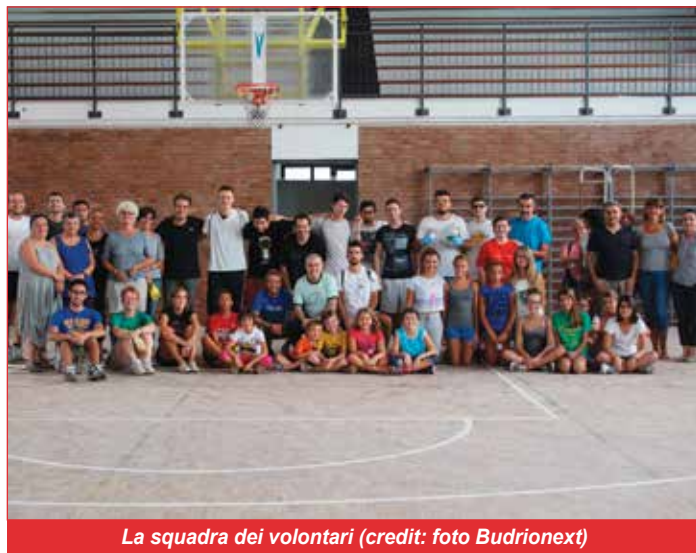
La squadra dei volontari