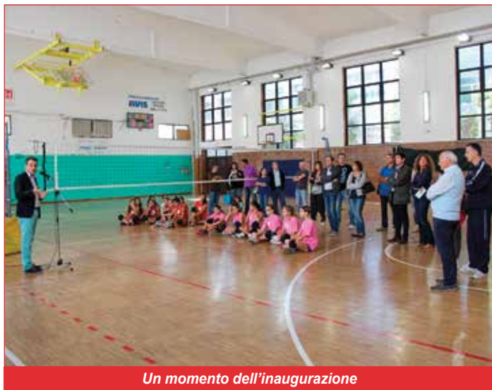
Un momento dell'inaugurazione

Per questo desideriamo affiancare alla foto dell'inaugurazione, quella del gruppo dei volontari che si è adoperato per il ripristino dell'impianto. ■