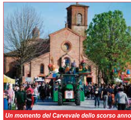
Un momento del Carnevale dello scorso anno

sideri potrà partecipare con un massimo di quattro fotografie scattate nel corso delle 18 edizioni precedenti. Le fotografie verranno raccolte e, dopo una selezione, le prime quattro verranno premiate l'anno successivo, in occasione del ventennale. Un bel modo per ricordare tutte le precedenti edizioni del "Carnevale del Torrione". Avremo modo di riprendere più dettagliatamente l'argomento nei prossimi mesi. Cogliamo sin d'ora l'occasione per ringraziare tutti i volontari e l'Amministrazione Comunale per il supporto e la disponibilità. ■