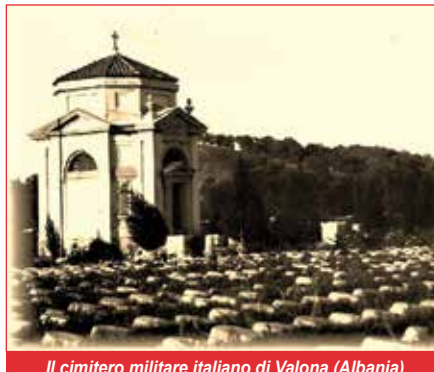
Il cimitero militare italiano di Valona (Albania)