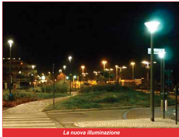
La nuova illuminazione