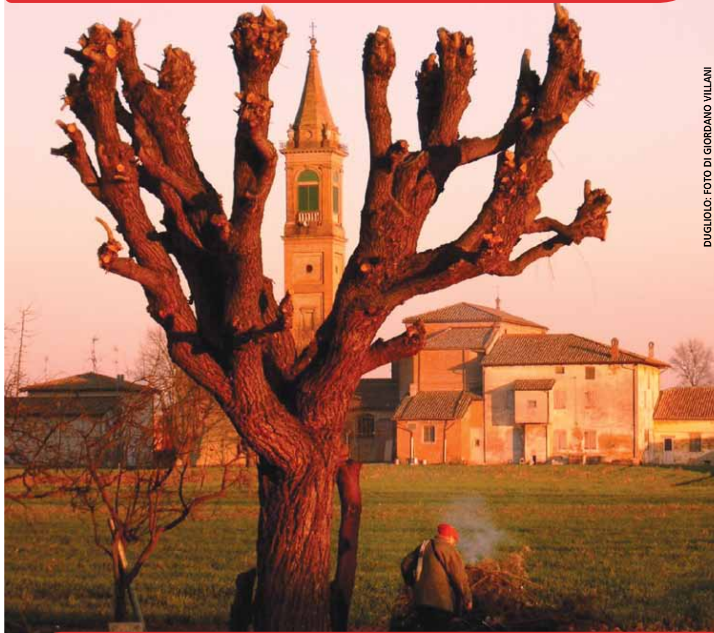
DUGLIOLO: FOTO DI GIORDANO VILLANI