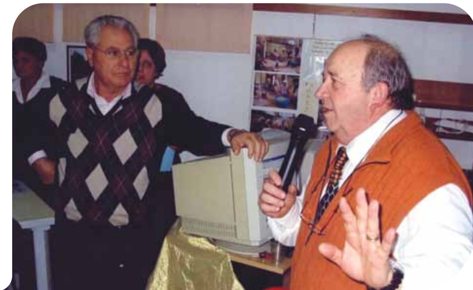
Centro Sociale La Magnolia

della Sezione dell'Associazione Italiana Dislessia di Bologna