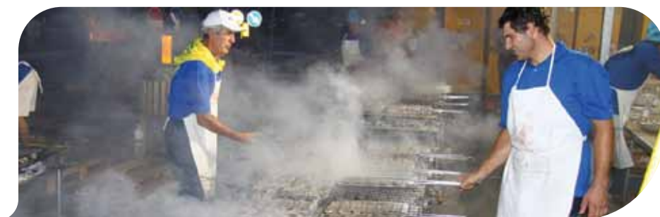
Un momento della grigliata

Tolte le spese, il ricavato sarà devoluto alla "Stanza di Giacomino", reparto di neuropsichiatria infantile ad alta tecnologia che la Fanep intende realizzare all'Ospedale Sant'Orsola. ■