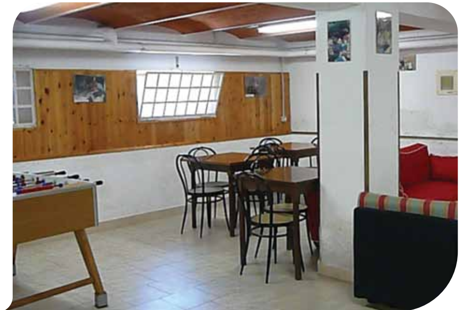
Nella foto un angolo della sala di ritrovo per i giovani