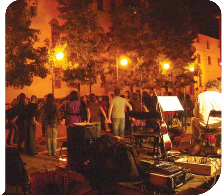
Scorsa edizione "Una Notte ai Musei"

Sabato 26 settembre, eventi, spettacoli e negozi aperti