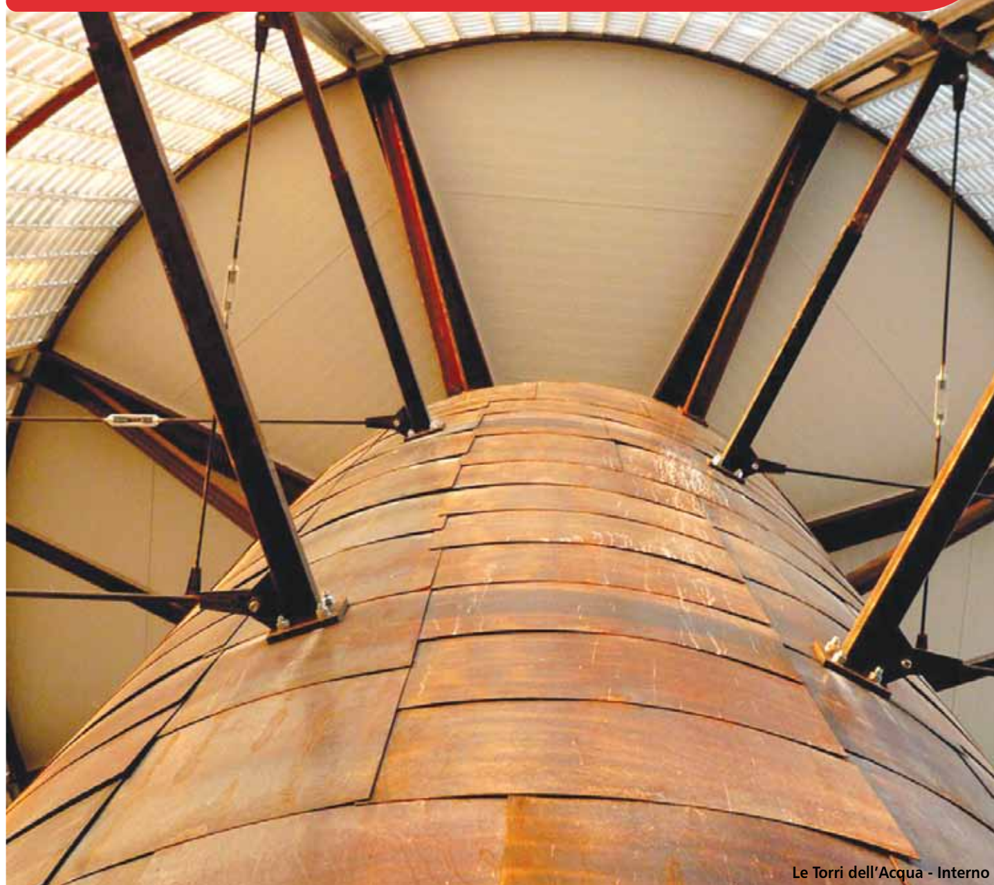
Le Torri dell'Acqua - Interno