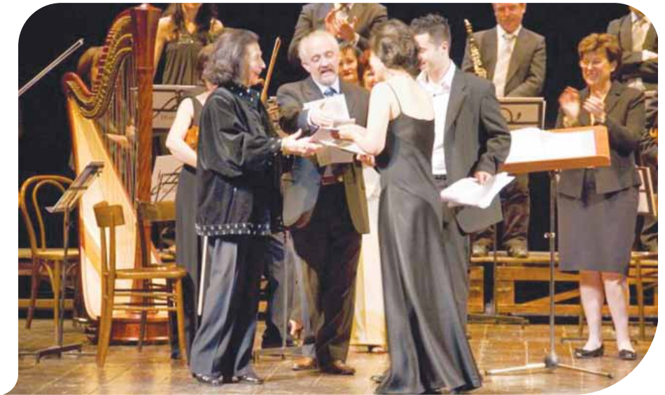
Nella foto la consegna del Premio Anselmo Colzani 2009