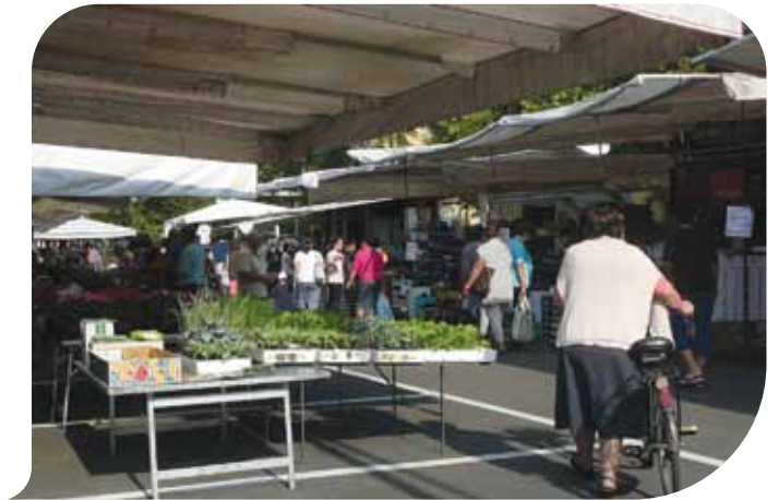
Il mercato di Budrio

Al momento, le ipotesi sulla nuova collocazione del mercato sono tre: la prima, nella zona tra Piazzale della Gioventù e via Massarenti che offre massime condizioni di sicurezza poiché consente il passaggio dei mezzi di soccorso in tutto il percorso e la concentrazione degli ambulanti in un'area più definita e omogenea; la seconda nello spazio di via Verdi e l'area dell'ex lavatoio adiacente all'entrata della fermata del treno di Budrio Centro che garantisce le necessarie condizioni di sicurezza ed omogeneità, ma presenta problematiche con riguardo alla sovrapposizione con le manifestazioni Agribu e Primavera; la terza in un percorso articolato che si sviluppa tra via Martiri Antifascisti, Piazza Matteotti, Piazza Filopanti che presenta alcune criticità dovute alla disgregazione degli ambulanti e alle difficoltà di passaggio dei mezzi di soccorso, oltre alle deviazioni del percorso degli autobus TPER e del-