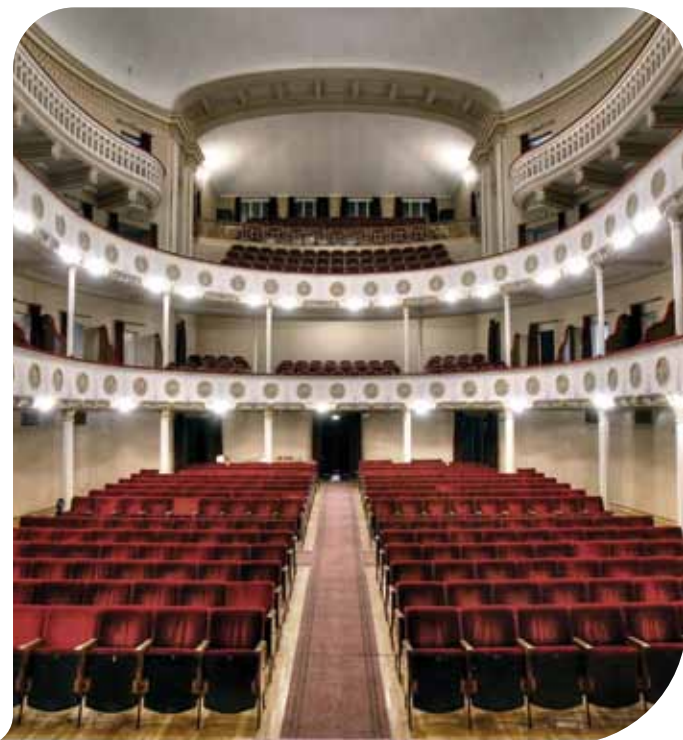
Il Teatro di Budrio

Giuseppe Verdi. Non mancherà l'operetta di fine anno, il 31 dicembre si festeggerà con La Vedova Allegra , cui seguirà il 1 gennaio Scugnizza . Completano il cartellone appuntamenti con il Teatro dialettale, il Teatro per ragazzi Burattinando a Budrio e per le scuole Consorziale Scuola . Fino al 2 novembre sarà possibile acquistare nuovi abbonamenti . Gli orari di apertura della biglietteria nei giorni di prevendita , sono: martedì, mercoledì, giovedì e venerdì dalle 16.30 alle 19. Sabato dalle 9 alle 13. Domenica e festivi chiuso. La biglietteria apre inoltre un'ora prima dell'inizio di ogni spettacolo. Potrete scaricare il programma completo sul sito del Teatro: www.teatrodibudrio.com ■