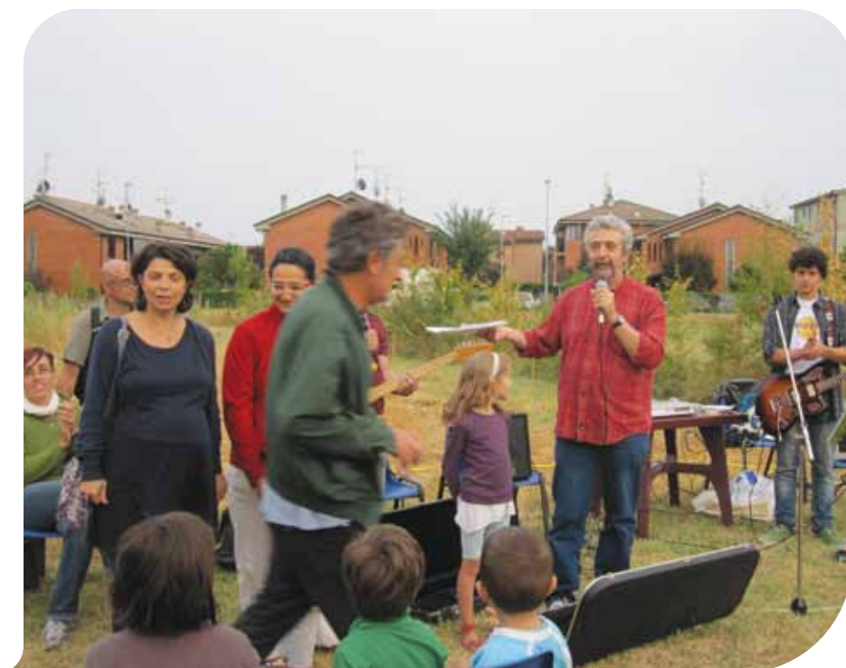
Un momento della festa annuale dell'orto sinergico