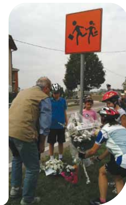
Fiori sul luogo dell'incidente