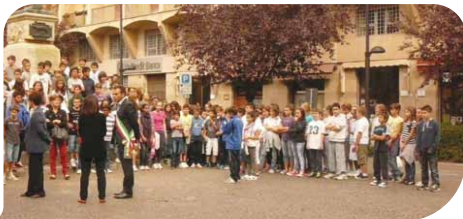
I ragazzi della scuola media in Piazza Filopanti