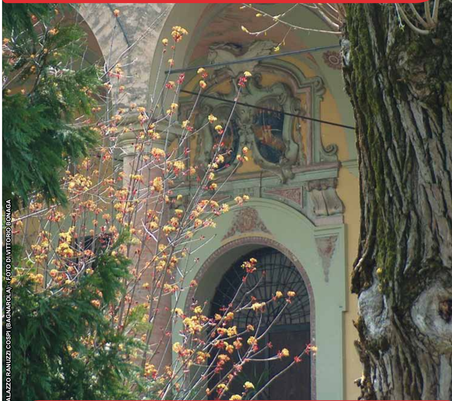
PALAZZO RANUZZI COSPI (BAGNAROLA) - FOTO DI VITTORIO BONAGA