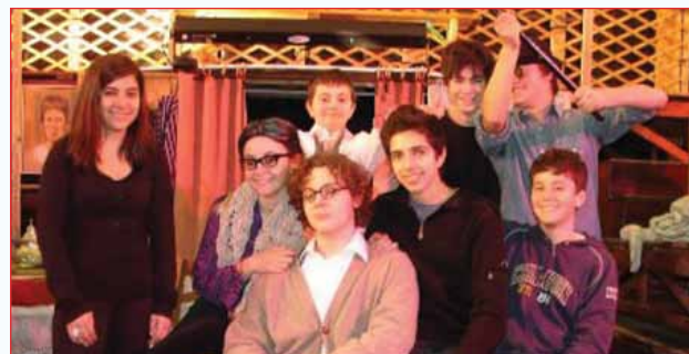
Gli attori dello spettacolo