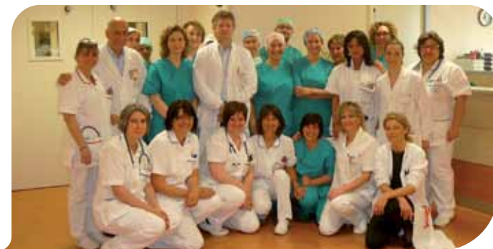
Lo staff di Chirurgia

tà non solo non sono calate ma, anzi, sono aumentate. Lo provano i dati.