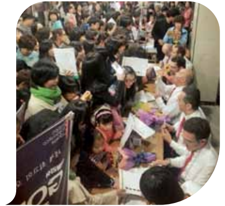
Caccia agli autografi al termine del concerto

Nei programmi futuri del GOB: una tournée in Cina nell'agosto di quest'anno ed una seconda tournée in Giappone nel 2015, anno in cui a Budrio ci sarà anche il Festival dell'ocarina. ■