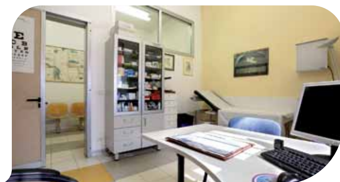
Un ambulatorio della Casa della Salute