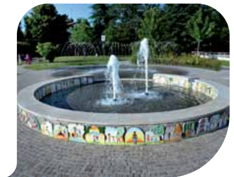
La Fontana dei Diritti in Piazza 8 marzo