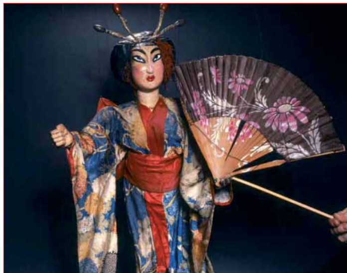
La Butterfly di Vittorio Podrecca

All'interno del percorso espositivo verrà creato un dialogo stretto con la rappresentazione artistica affiancando ai burattini opere pittoriche e scultoree create appositamente per questo evento, opere di alcuni fra i principali artisti della scena contemporanea chiamati a reinterpretare la marionetta, le sue funzioni, le sue passioni, la sua storia ed il suo fascino. ■