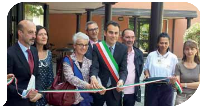
Sabato 7 giugno 2014: Il taglio del nastro

Il piano rialzato ospita il servizio di Neuropsichiatria dell'Infanzia e dell'Adolescenza, attivo dal mese di settembre, mentre al primo piano trovano spazio l'ambulatorio di Igiene Pubblica e l'ambulatorio infermieristico, con 4 infermieri e 1 operatore socio sanitario. Sono stati circa 1.200 i cittadini seguiti dall'ambulatorio nel corso del 2013, con oltre 17.000 prestazioni effettuate. Da settembre, infine, sempre al primo piano, saranno attivi anche il Consultorio familiare, con 3 ostetriche e 1 ginecologo, e la Pediatria territoriale, con 1 pediatra e 1 assistente sanitario. ■