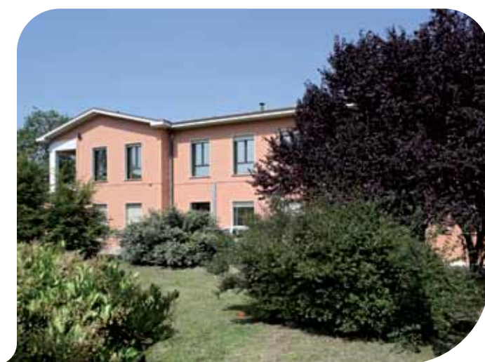
L'esterno della Casa della Salute