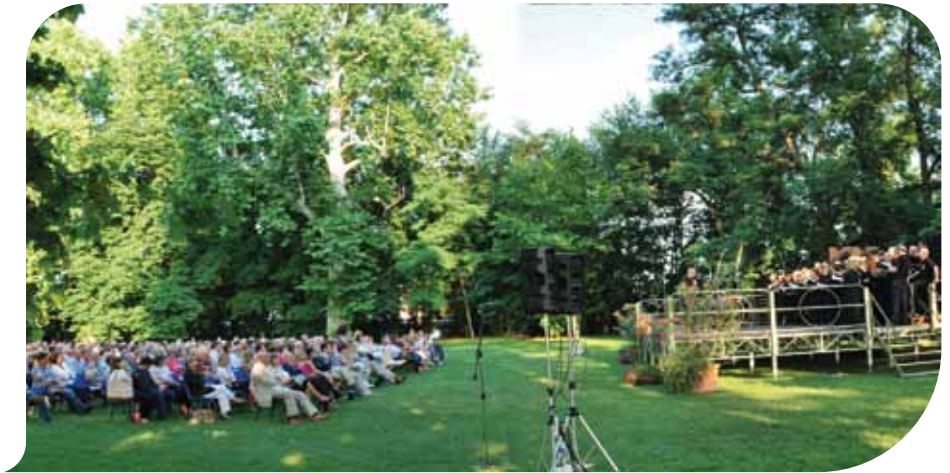
Una panoramica del pubblico e della Corale

Erano più di 500 gli spettatori che lo scorso 12 giugno si sono ritrovati nel parco secolare di Villa Giulia, a Maddalena di Casziano, per assistere ad Invito all'Opera , il pomeriggio campestre in occasione del Centenario della Corale Bellini di Budrio. Il concerto, vocale e strumentale, che ha inaugurato la rassegna di Budrio Estate, è stato diretto dal maestro Roberto Bonato e sono state eseguiti, fra gli altri, alcuni brani della Traviata e del Nabucco e dall'opera I lombardi alla prima crociata. Grande emozione quando la Corale ha intonato l'Inno di Mameli e tutto il pubblico si è alzato in piedi per cantarlo insieme ad coro. ■