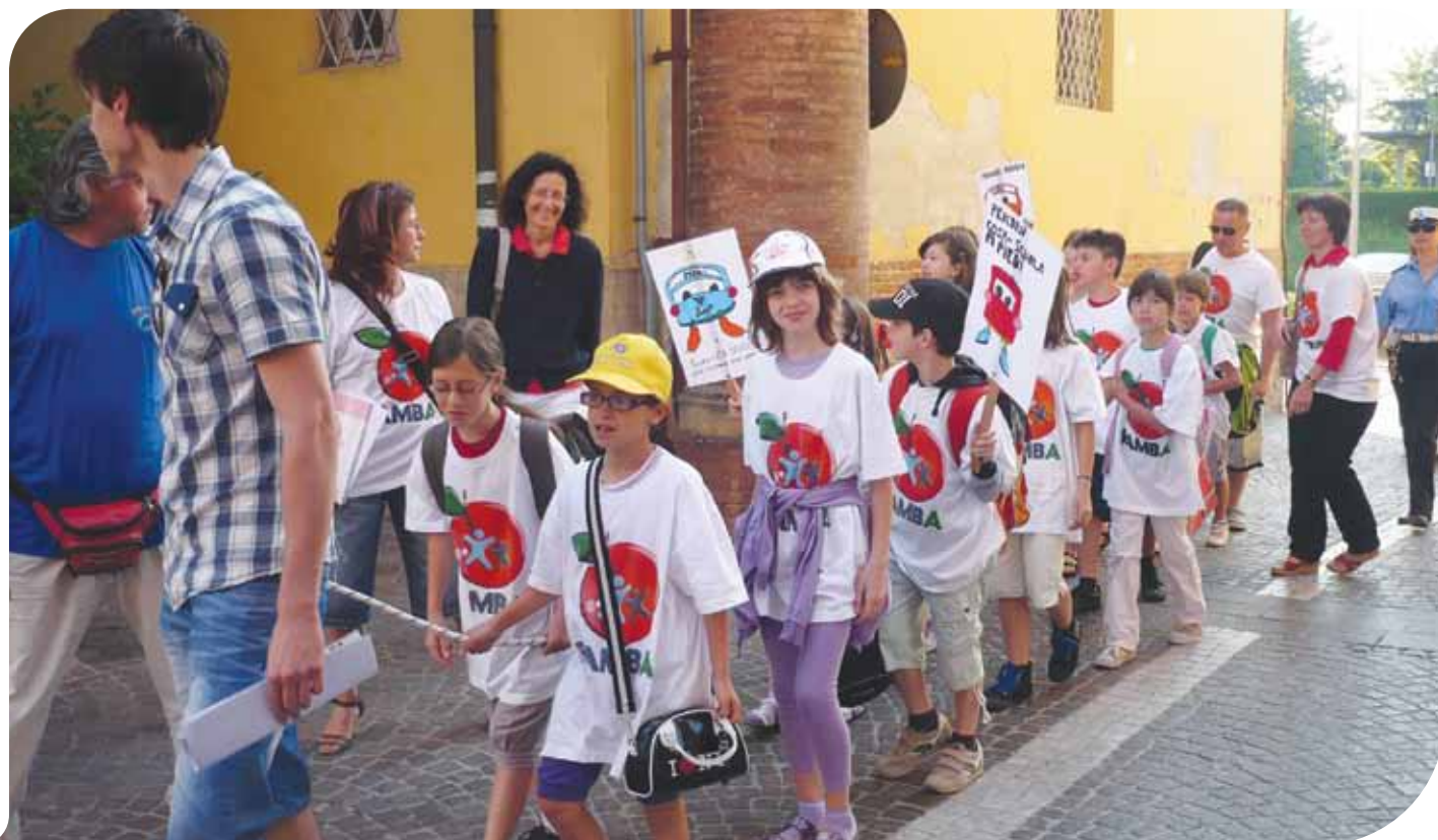
Il Pedibus entra in centro storico da Via Verdi

Il progetto SAMBA vede il Comune di Budrio, l'Azienda USL di Bologna, l'Università, la UISP e le scuole primarie realizzare insieme azioni integrate, finalizzate al miglioramento delle abitudini alimentari e all'incremento dell'attività motoria nei bambini.