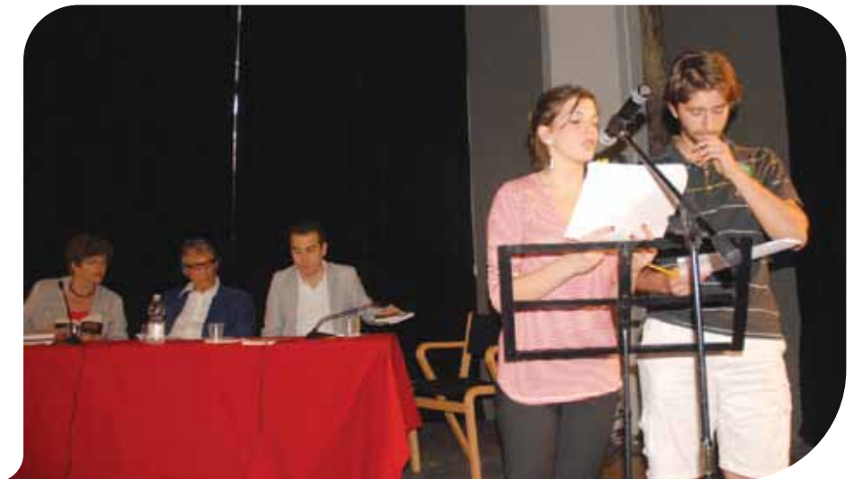
Due momenti delle letture dei ragazzi del Giordano Bruno

essendo i vari testi, redatti da autori per la maggioranza non noti al grande pubblico, essi hanno in comune l'adozione di un linguaggio raffinato ma semplice che riesce ad accompagnare il lettore nel profondo degli argomenti trattati. E' la divulgazione che diventa la "mission", si fa politica culturale e si traduce nell'accoppiata lin-