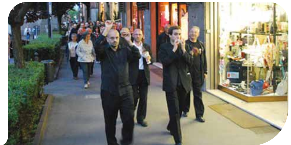
Un momento del percorso da una chiesa all'altra