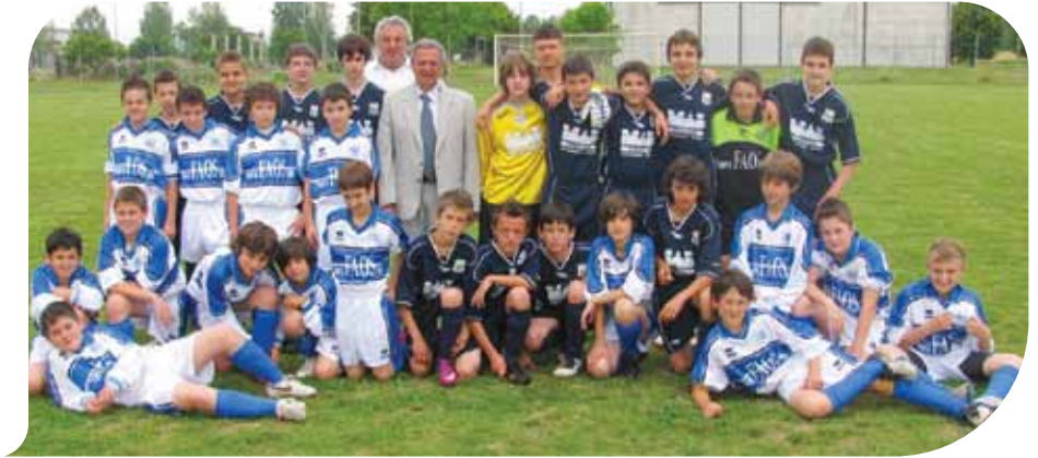
Il Sindaco con i ragazzi del Mezzolara sul campo di Prunaro