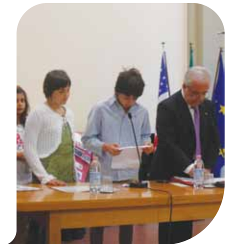
Premiazione del Lions Club

Il Comune che ha anche promosso incontri col procuratore e in collaborazione col