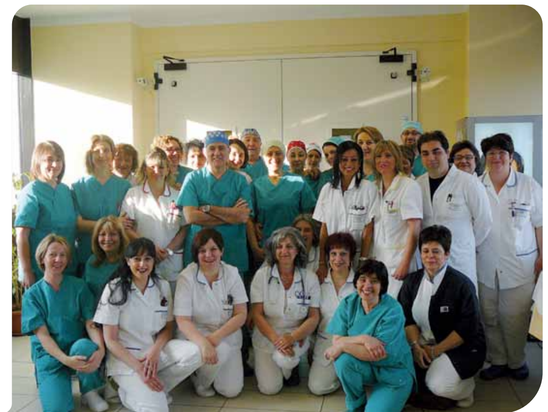
Lo staff della Chirurgia dell'Ospedale di Budrio

Sicuramente sì. L'obiettivo della nostra attività qui a Budrio è duplice: da una parte vi è la ricaduta positiva per il Sant'Orsola Malpigli, a cui serviva delocalizzare la quota dell'attività chirurgica a medio-bassa complessità per dare maggior spazio e risorse al