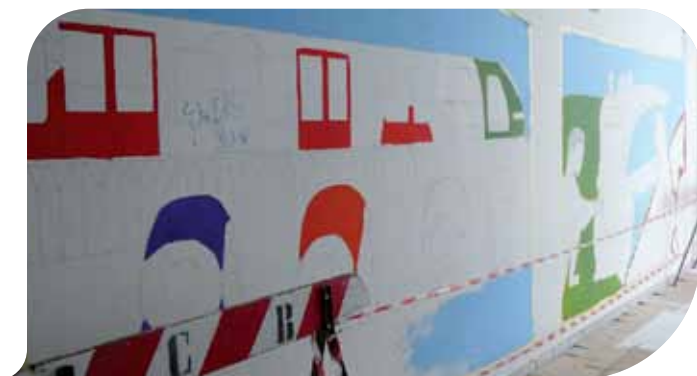
Uno dei murali in via di realizzazione