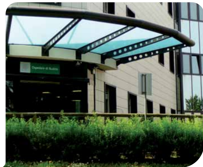
L'ingresso dell'Ospedale di Budrio

Oltre all'équipe stabile, contribuiscono a rotazione altri chirurghi del S.Orsola secondo il criterio del volume di lista di attesa come già accennato. La nostra struttura si caratterizza per essere una chirurgia "a ciclo breve" (week