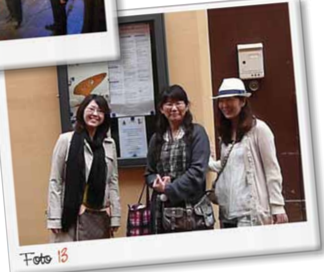
FOTO 7: Concerto d'arpa e ocarina alla chiesa del Borgo FOTO 8: Concerto dei ragazzi della scuola d'ocarina FOTO 9: Concerto d'organo e ocarina in Sant'Agata FOTO 10: In partenza per l'ocarina parade FOTO 11: La Banda di Brosso FOTO 12: Concerto d'ocarine e orchestra del 30 aprile a Teatro FOTO 13: Alla scoperta di Budrio