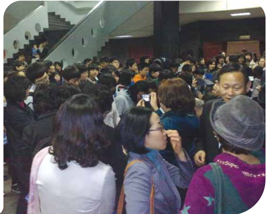
Folla in attesa degli autografi

La tournèe, completamente finanziata dagli organizzatori coreani, ha avuto un successo molto sopra le aspettative