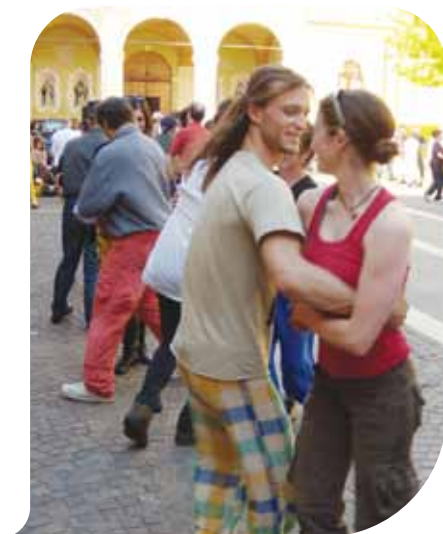
Balli in Piazza Antonio da Budrio