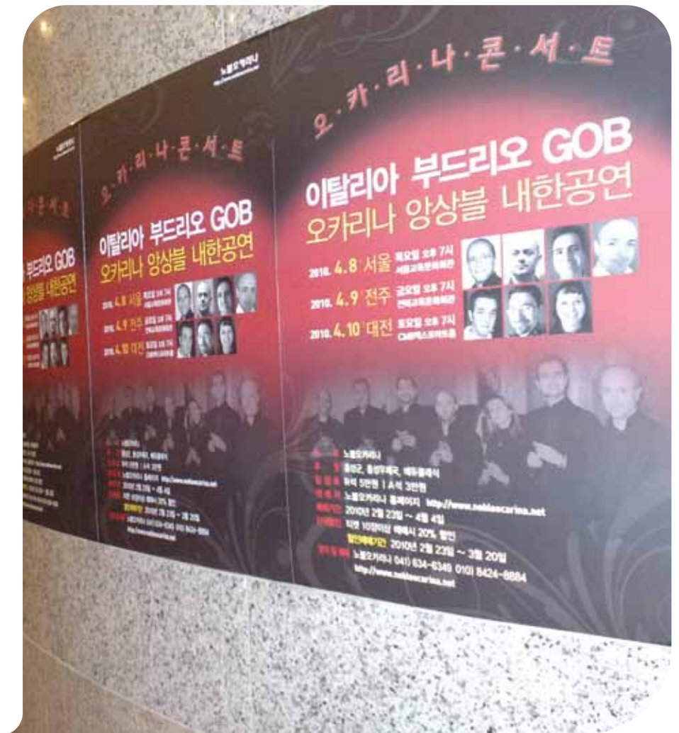
Manifesti nella hall del Teatro