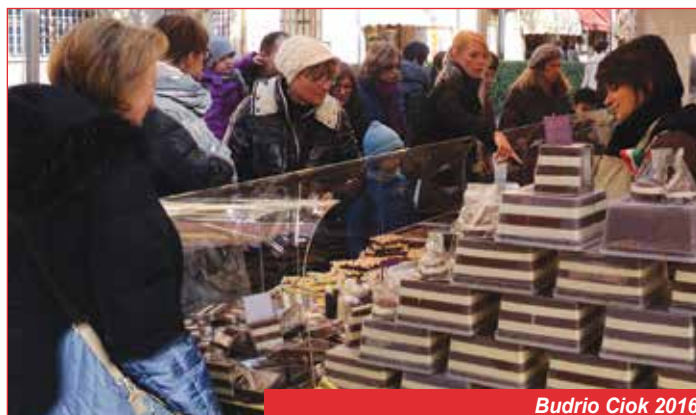
Budrio Ciok 2016

Nelle vie laterali, mercatino di Fantacrea , a completare con le sue meraviglie, la giornata.