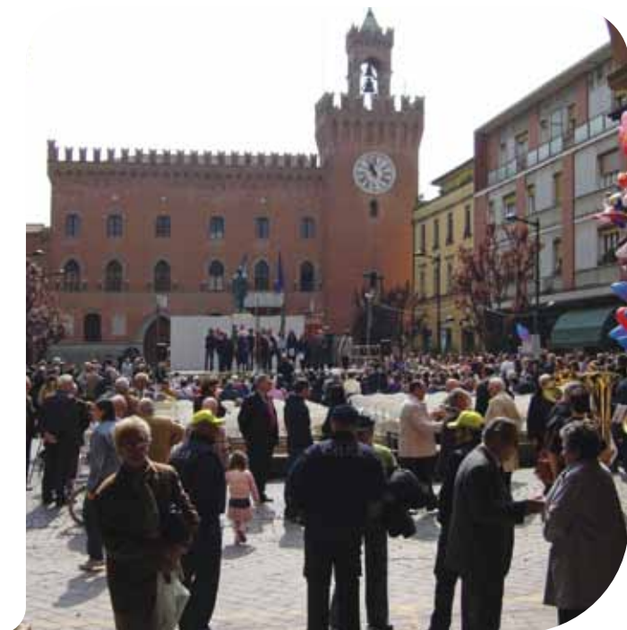
Primaveranda: Piazza Filopanti