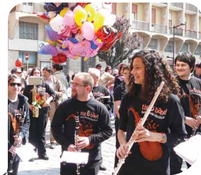
Primaveranda: La B Band

la Corale Bellini, con la mostra Budrio Canta a Palazzo Medosi-Fracassati e gli spettacoli alle Torri dell'Acqua. Quest'anno ritorna il Festival Internazionale dell'Ocarina, dal 28 aprile al 1 maggio. Nonostante lo spaventoso cataclisma che ha sconvolto il Giappone, abbiamo notizia che i nostri amici nipponici saranno presenti insieme con altri musicisti orientali e da tutto il mondo, alla grande kermesse musicale. Prepariamoci a salutare con affetto i fratelli giapponesi. Durante le giornate del festival saranno presenti i mercatini dei costruttori artigianali d'ocarine e fischietti in terracotta, decine di artigiani da tutte le parti del mondo, che esporranno e venderanno i loro prodotti. Venerdì 29 aprile