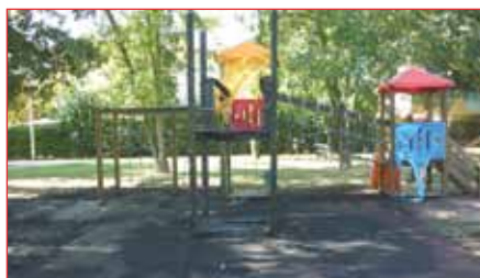
Il parco Giovanni XXIII