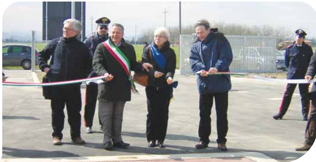
Il Sindaco Carlo Castelli, la Presidente della Provincia Beatrice Draghetti e l'Assessore Renzo Venturoli all'inaugurazione della nuova stazione ecologica

Un impegno dell'Amministrazione per una collettività più ecoresponsabile