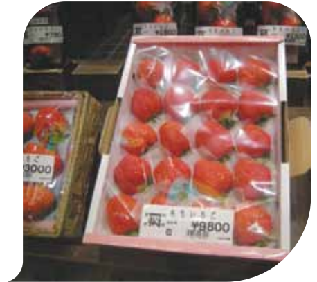
"Offerta speciale" al mercato di Kyoto: 20 fragole a 9800 yen (80 euro!!!!)