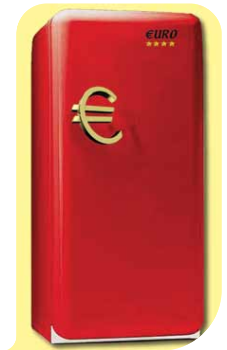
Il 'frigo' protagonista della commedia

Dal 2008 poi, in collaborazione con l'attuale amministrazione comunale, la com-