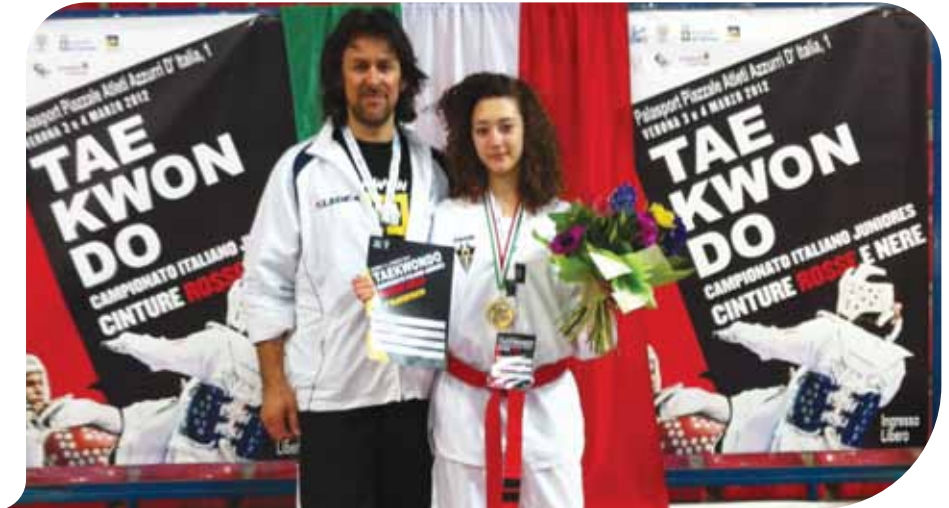
Nella foto il podio della categoria juniores -44 cinture rosse

to e tutti i ragazzi che si impegnano con dedizione e passione quotidianamente. ■