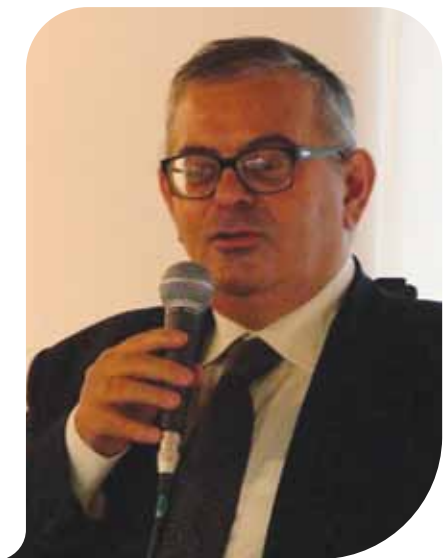
Nella foto il critico Marzio Dall'Acqua