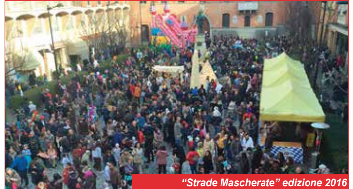
"Strade Mascherate" edizione 2016

delle scuole materne ed elementari di Budrio e frazioni. Non ci saranno infatti carri che sfilano ma solo i bambini e i loro accompagnatori che saranno come lo scorso anno il centro del Carnevale. Gli unici due carri, fissi in piazza Filopanti, saranno quelli della Scompagnia del Torrione e della Ballotta, dai quali avverrà il lancio di coriandoli, piccoli premi e gadget per tutti i bambini e che, insieme a trampolieri, circonsi e musica live, animeranno il Carnevale nella piazza e nelle strade. Anche quest'anno verrà allestito lo stand gastronomico gestito dall'Associazione Amici delle Scuole il cui ricavato andrà, come per la scorsa edizione,