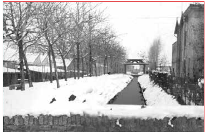
Il lavatoio e il canale Fossano in una foto della fine degli anni '60

Luce - Gas - Green Solution - Consulenza Energetica - Impiantistica