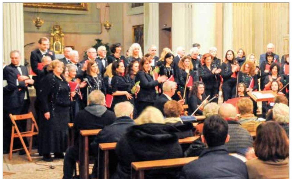
LA CORALE BELLINI

all'opera "Don Pasquale" di Donizetti presso il Teatro Consorziale e l'esecuzione dei Carmina Burana di Carl Orff. ■