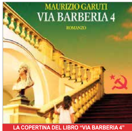
LA COPERTINA DEL LIBRO "VIA BARBERIA 4"