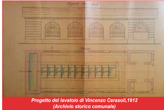
Progetto del lavatoio di Vincenzo Cerasoli, 1912

Il fabbricato comprendeva vaschette (capienza 160 litri), separate per ciascuna lavandaia, con rubinetti a chiusura automatica, "di modo che il consumo viene limitato al puro necessario" e si rinnovava continuamente il contenuto con acqua pulita proveniente dall'acquedotto. La copertura era "a terrazza in piano"