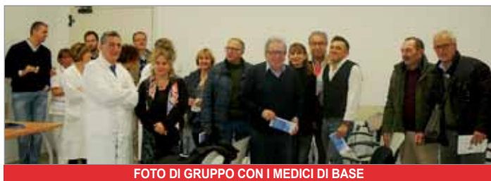
FOTO DI GRUPPO CON I MEDICI DI BASE