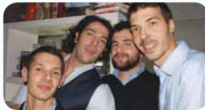
Lo staff di Aqua Bar

Una nuova iniziativa ha preso vita alle Torri dell'Acqua, per offrire un aggiuntivo servizio alla cittadinanza e connotare il luogo come punto di aggregazione attivo, in modo particolare per la popolazione più giovane. Si è inaugurato infatti, lo scorso 17 dicembre, "bevi AQUA responsabilmente" il Bar delle Torri dell'Acqua di Budrio. La Fondazione Cocchi ha individuato nella Società 6sensi, il partner ideale per la gestione dello spazio ristoro della struttura. La società 6sensi, che vanta una lunga esperienza nel settore dell'ospitalità e della ristorazione ha effettuato un forte investimento nella struttura ed è in grado di garantire la copertura per qualsiasi evento in programma alle Torri oltre a creare lei stessa eventi su misura. Ad un anno dall'inaugurazione dell'ex acquedotto, all'interno del quale è stato proposto con successo un calendario di eventi che spaziano in vari ambiti delle arti, nasce il concept Cocktail Bar "bevi AQUA responsabilmente" che sarà aperto tutti i giorni dalle 18.00 alle 01.00 per offrire un servizio non solo agli utenti delle Torri ma anche a tutta la cittadinanza budriese. Come i molti artisti che si sono lasciati sedurre dal fascino dell'edificio ed hanno prodotto creazioni ad hoc per le Torri dell'Acqua anche Luca Soldati, creativo, consulente d'eventi e di ristorazione, e Giacomo Diamante, barman di curriculum nazionale, insieme ai loro collaboratori Andrea